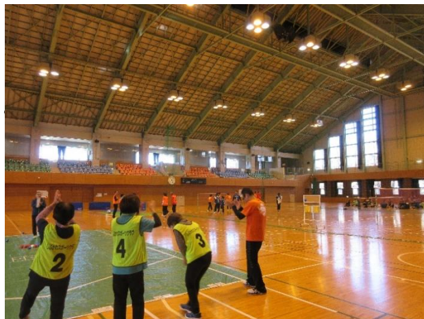
老若男女だれでも楽しめる ユニバーサルスポーツ

参加者は4つのチームに分かれ、指導者の指導のもと、シッティングバレーボール、さいかつボール、ポッチャ、モルックの4種目を順番に体験しました。参加者からは、ファインプレーが起こるたびに歓声が上がるなど、どの種目も盛り上がりを見せていました。